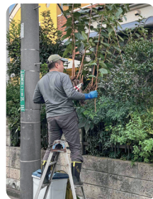
ちょこっとお手伝い