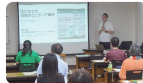
はじめての災害ボランティア講座

当協議会は、府中市との協定により、市内で災害が発生し被害が出た場合、災害支援の拠点として災害ボランティアセンターの立ち上げを担う役割をもっています。災害に備えて、災害ボランティアセンターの設置運営訓練や防災まち歩きなどを市民の皆さまと実施しています!