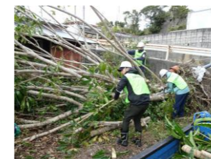
倒木処理。チェーンソーで短く切って軽トラで運び出します。