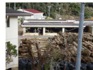
土石流災害で流れてきた大量の倒木