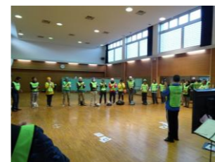
「あすなろ」に集結した島内外のボランティアさん