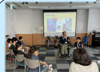
くるまいす たいけん 車椅子を体験してみよう