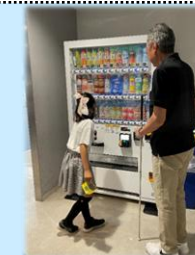
み 見え ない 『見えにくい』 を体験してみよう