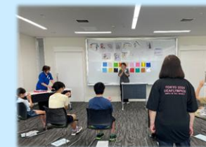
しゅわ こうりゆう 手話で交流してみよう