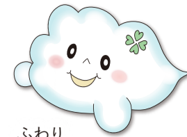
ふわり 社協マスコットキャラクター